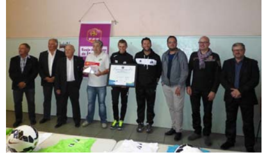
Le label féminin et le label de bronze pour la Croix Blanche Angers