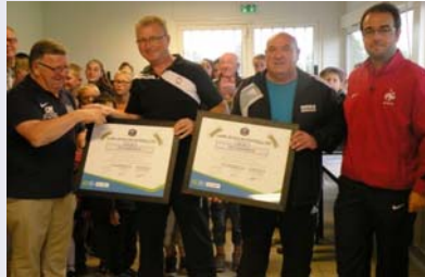
Le label de bronze pour l'ES Puy Vaudelnay