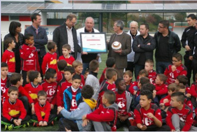
Le label d'argent pour le SO Cholet

Des efforts et du travail ...voilà la recette pour obtenir un label. Durant le mois d'octobre de nombreux clubs ont reçu cette récompense tels que Trémentines, Val de Moine, St Hilaire Vihiers, St Aubin JS Layon, Andrezé Jub Jallais et Beau-preau. Ces remises de label se poursuivront durant les prochaines semaines.