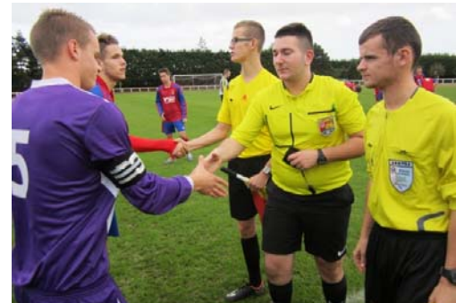
Un trio à pied d'œuvre