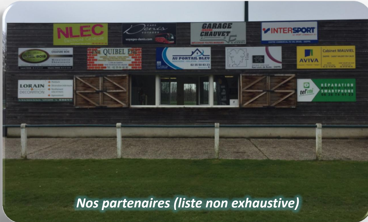
Nos partenaires (liste non exhaustive)