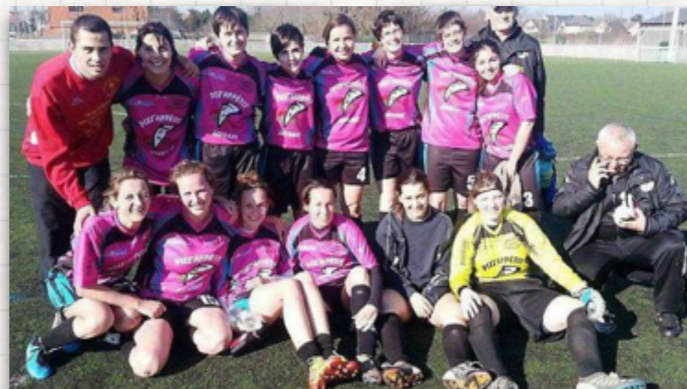
2013: 1/4 de finaliste de la Coupe Atlantique seniors

Basé sur un projet simple de respect de soi et des autres dans le respect des règles de vie d'un groupe, la section féminine essaie de respecter au mieux les valeurs du sport (humilité, simplicité et dons de soi) dans la bonne humeur