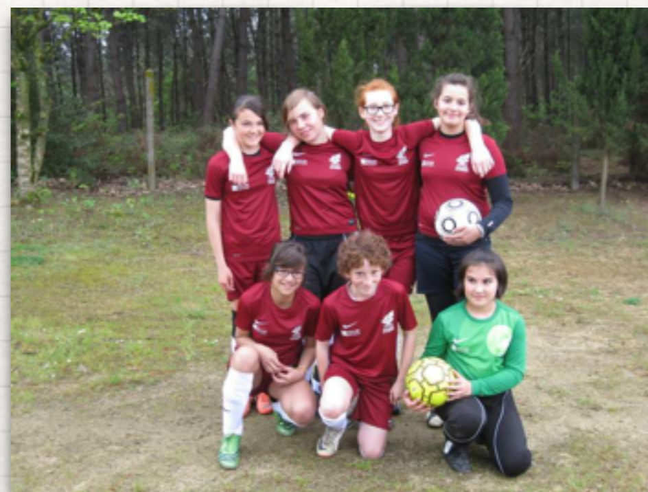
2012: L'équipe U13F est championne départementale