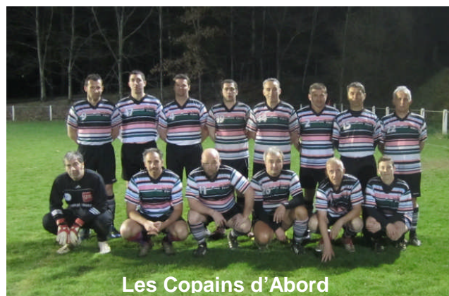
Les Copains d'Abord