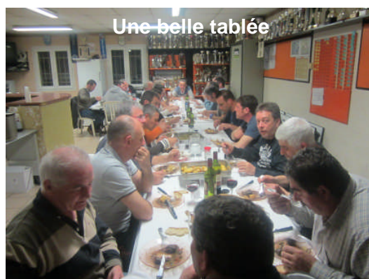
Une belle tablée

Nous poursuivrons avec nos hôtes autour d'un menu sympa pour conclure comme il se doit une soirée de foot loisir réussie. Nous lançons une invitation à nos hôtes pour partager la première animation de célébration de nos 20 ans, le vendredi 20 juin à Noailles avec une démonstration de foot free style en prélude à la diffusion d'un match de coupe du monde.