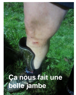
Ça nous fait une belle jambe