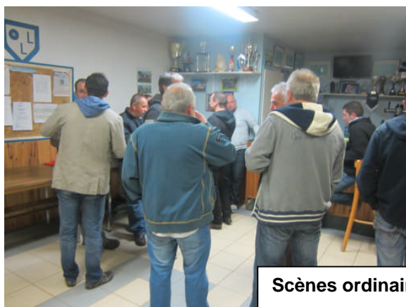
Scènes ordinaires du foot loisir