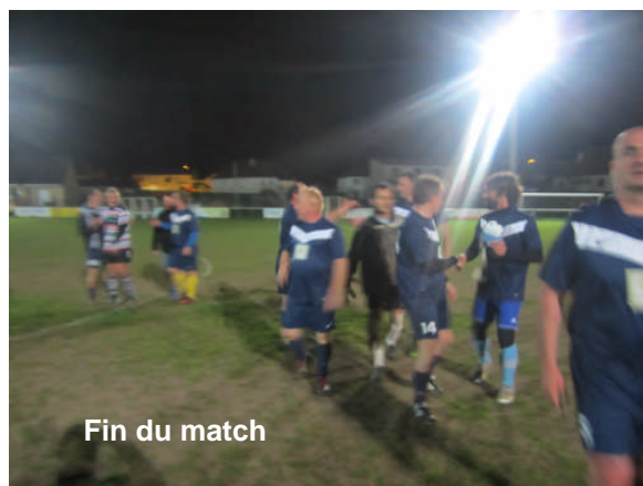
Fin du match