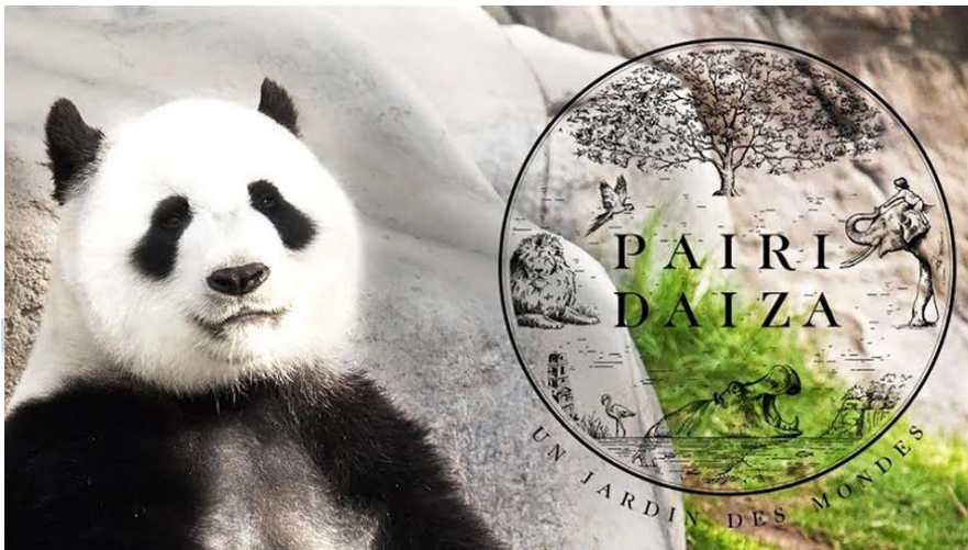
Pairi Daiza à 17 km Meilleur Zoo d'Europe en 2018