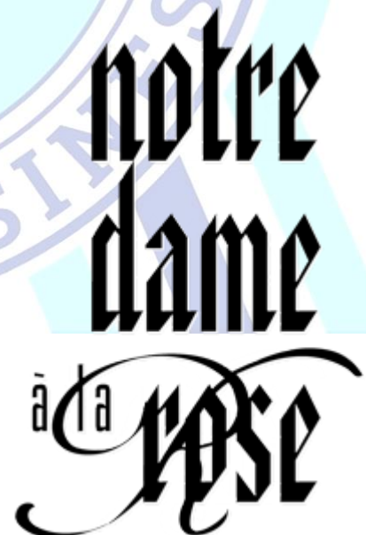
Notre Dame à la Rose à 5 km