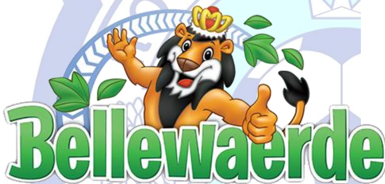
Parc d'attractions Bellewaerde (Ypres) et Walibi (Wavre) à 88 km