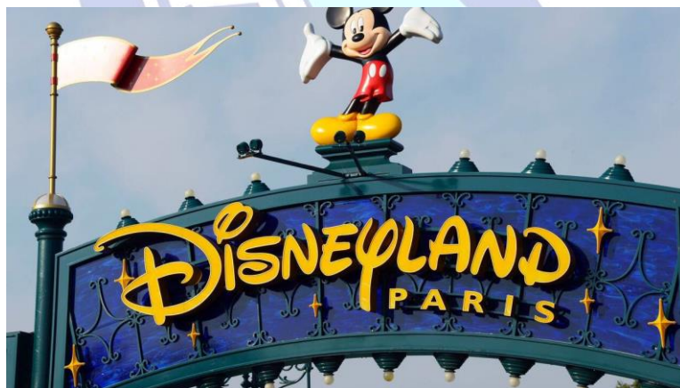
Parc d'attraction Dysneyland Paris à 290 km