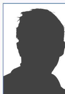
EDUCATEUR U13 CARAVETTI Julien