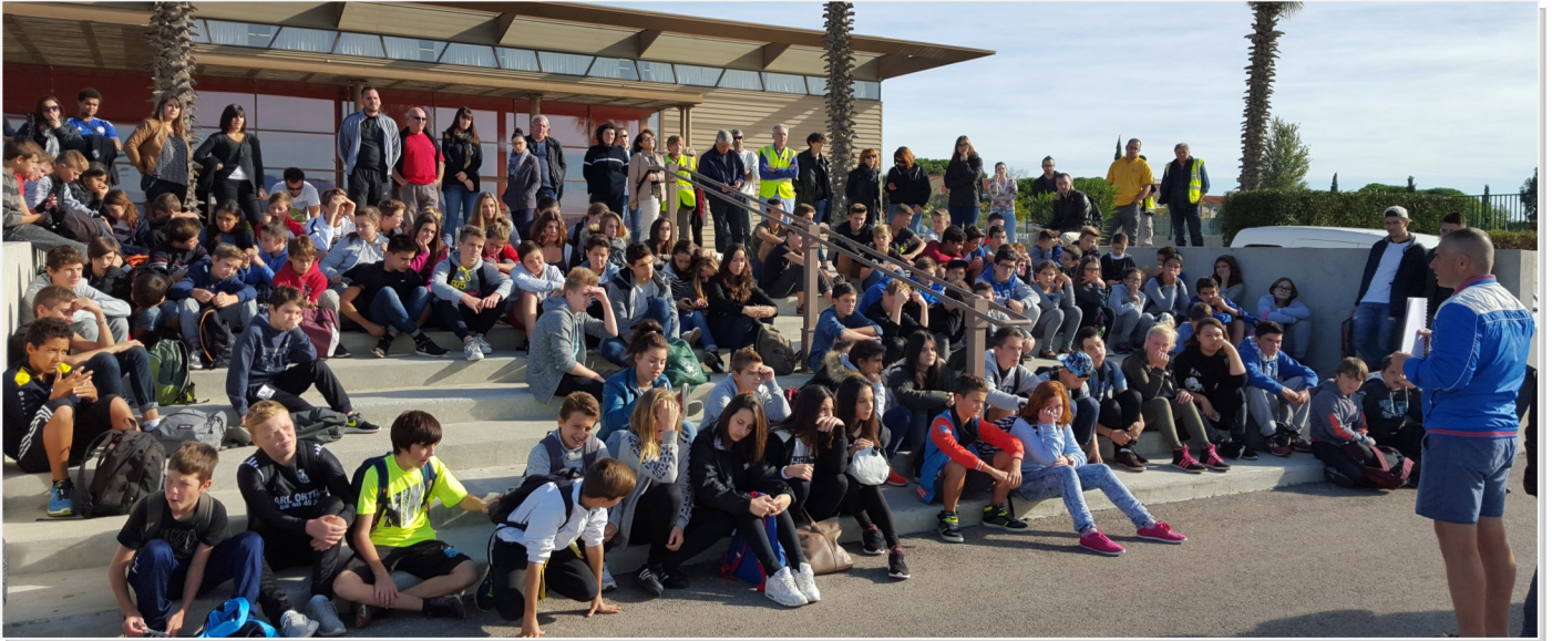
Les 10 ans du PIJ : une journée ludique, culturelle et préventive dédiée à la jeunesse.

Bien que le Point Information Jeunesse ait fonctionné auparavant dans le local qui n'était autre que celui occupé aujourd'hui par la Police Municipale, c'est l'année 2005 qui va révéler au public sa véritable dimension.