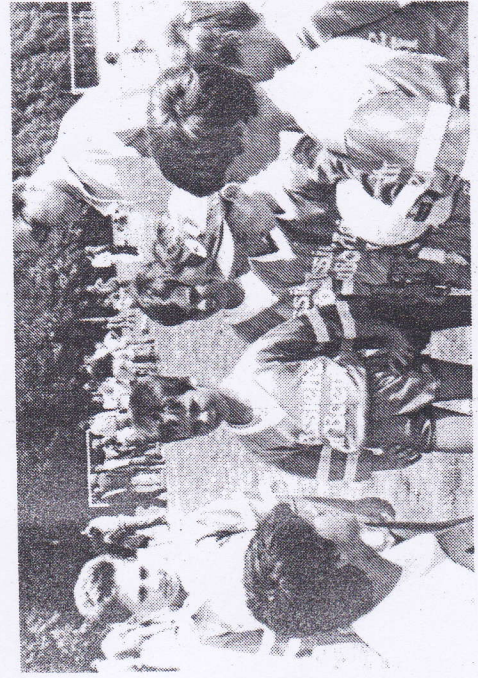
Les derniers conseils de l'entraîneur.

En catégorie minimimes : 1. Milan, 2. Balaruc; En pupilles : 1. Lavaur; 2. Limoges;