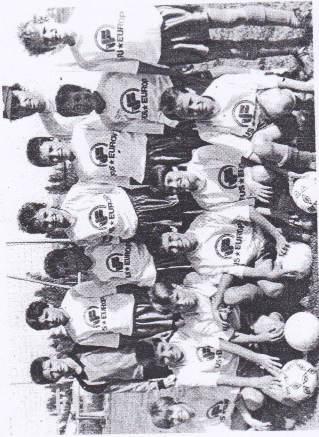
Les équipes de Lavaur, vainqueur en catégorie pupille.

rideau est tombé pour la septième fois, après quelques semaines de bonnes vacances bien méritées pour les « artistes ».