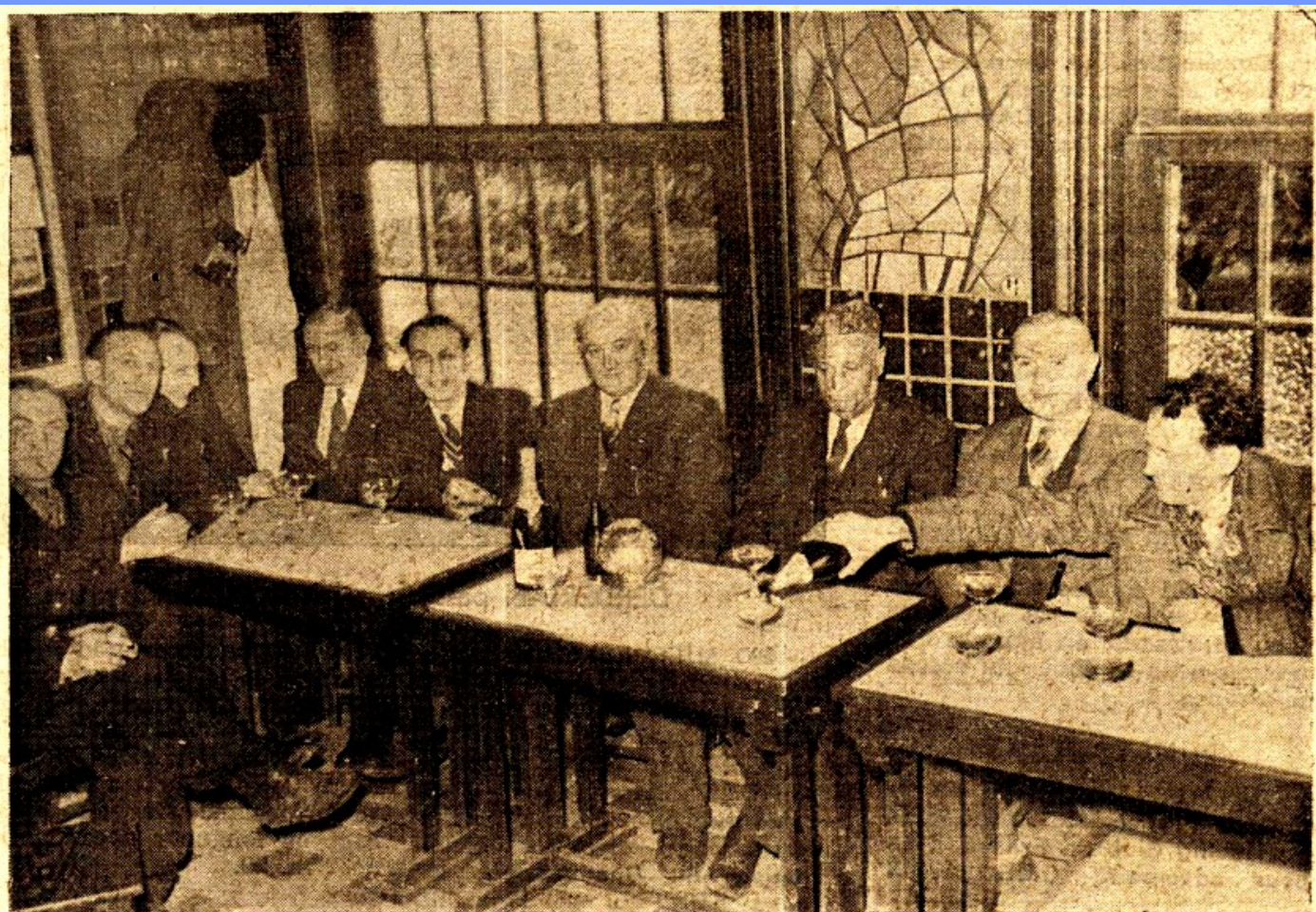
Les adieux de l'A.S.S.B. à son président d'honneur