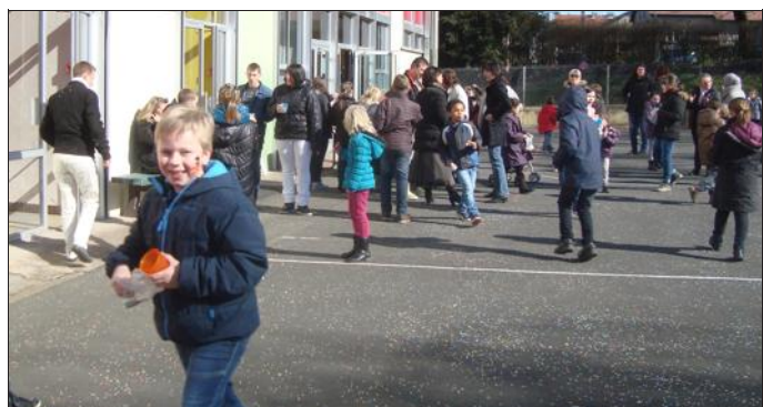
Une matinée carnavalesque qui s'est terminée avec de bons beignets.

Pour l'édition 2015 du carnaval à l'école élémentaire Edmond-About, les maîtresses ont quelque peu innové. En effet, ni costumes ni défilé, mais ce sont quatre ateliers sur le thème de carnaval qu'elles ont organisés durant toute une matinée.