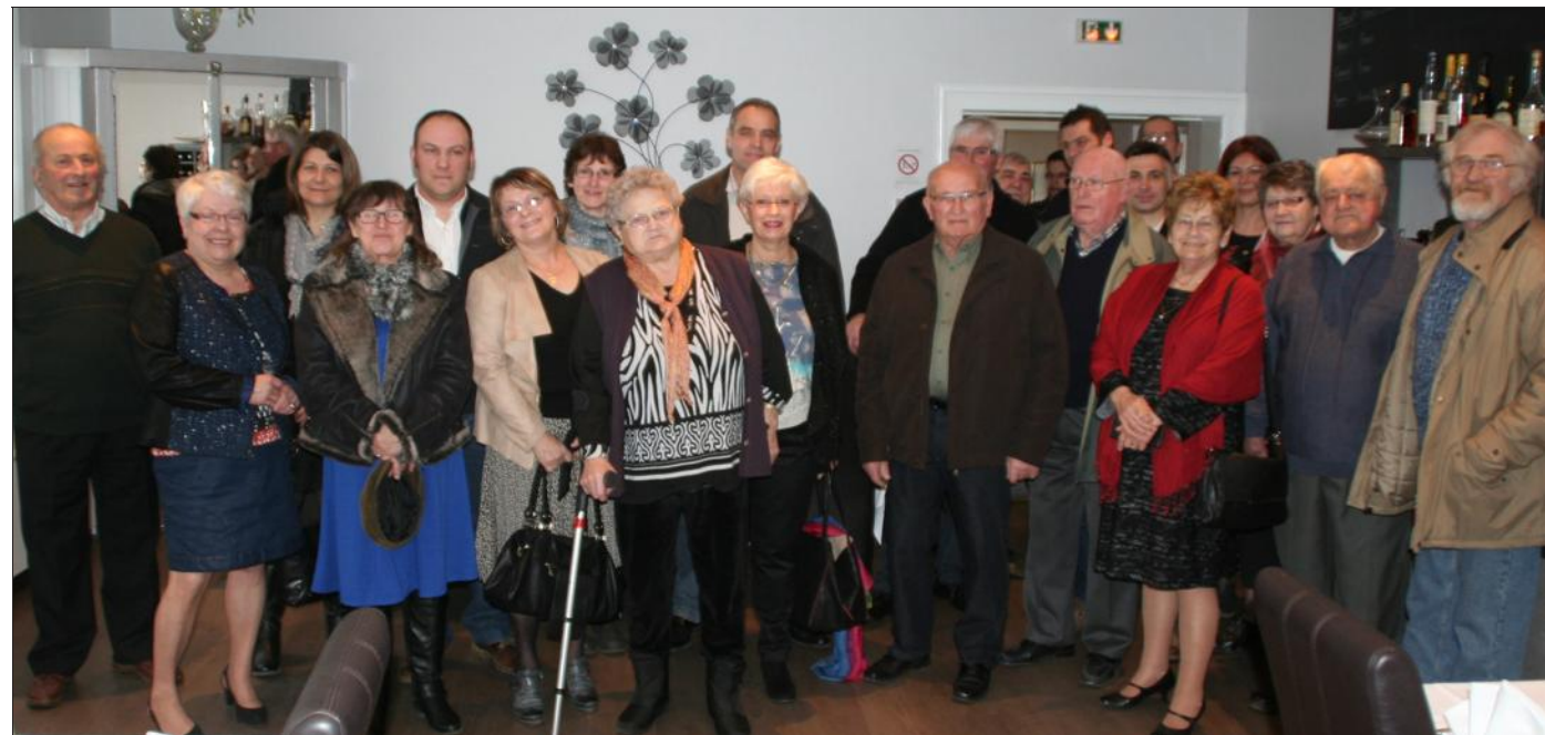
Les villageois et une partie du conseil municipal.

Le territoire possède une agriculture développée et prospère et notre région peut aussi compter