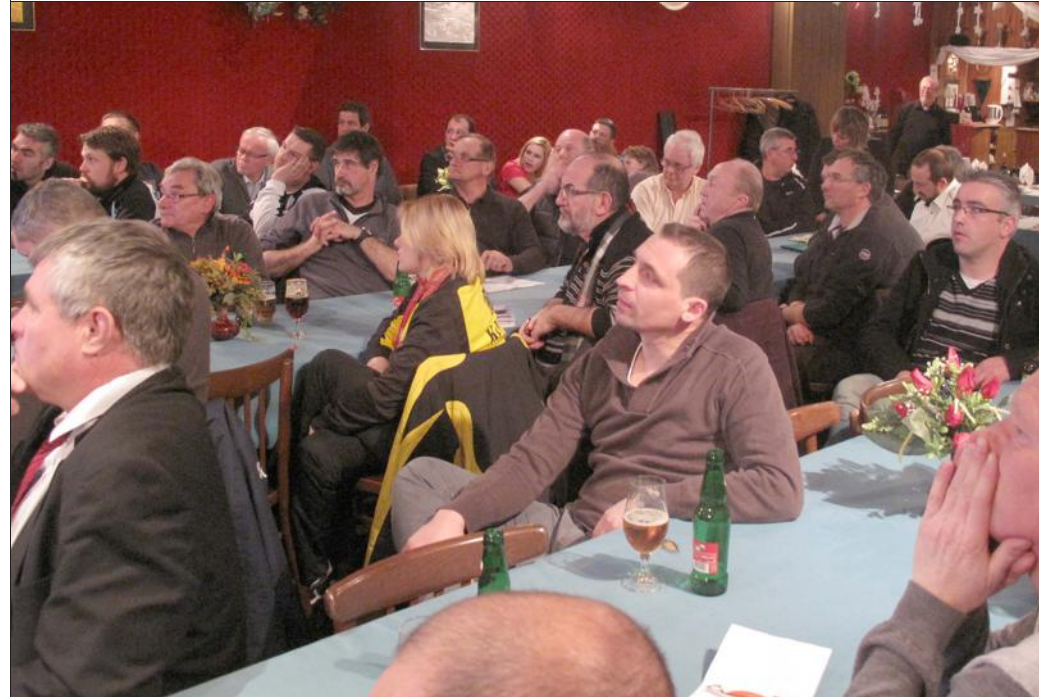
Les animateurs des clubs du secteur s'étaient déplacés nombreux pour entendre de leurs propres oreilles quelles seront les conséquences de l'introduction de l'informatique dans leurs pratiques.

Cette année, deux sujets font l'objet d'une information de la part des responsables du