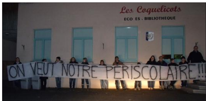
« On veut notre périscolaire », telle était la devise des parents.