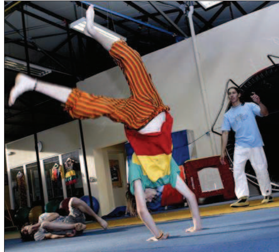
L'année électorale qui vient de s'achever n'a pas vraiment permis de nourrir l'ambition d'implanter dans le Saulnois une véritable école de cirque. Aussi, Cirque en sel, avec ses ateliers et spectacles, calmera les ardeurs frustrées du public local.

Ce même mercredi à 19 h, le cirque Rouage donnera au château d'Aulnois des allures de chapiteau. Carte blanche, les organisateurs la donnent aux Circassiens du dimanche, le 11 mai sous le chapiteau de