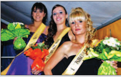
Pour Miss Mirabelle 2013 et ses dauphines, la fête de la mirabelle de l'ASBH reste un beau souvenir. À qui la succession ? Les inscriptions sont ouvertes.

Les inscriptions sont à effectuer auprès de Marilyn Colmerauer, en téléphonant au 06 87 69 84 84. Plus de précisions sont à découvrir sur le site de l'ASBH : http://asbhbottorcheville.footoo.com , dans sa rubrique « Manifestations ».