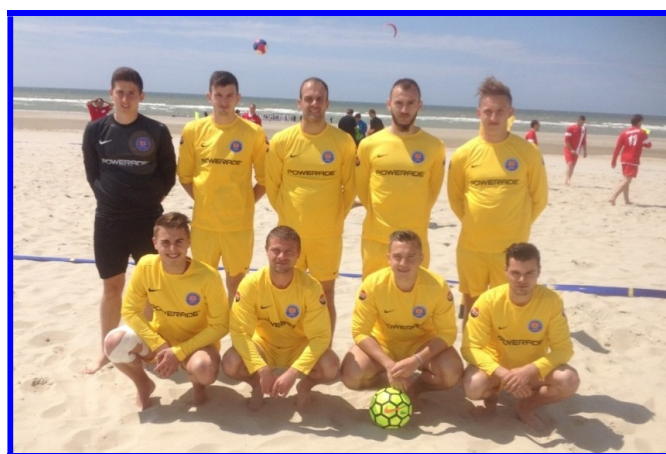
La sélection Beach Soccer de la Ligue Nord/Pas de Calais de football

En définitif, ce sport a toute sa place dans notre région, et peut se pratiquer d'avril à octobre. Il va nous falloir pour cela, multiplier les terrains et continuer notre campagne de communication et de sensibilisation. Le Beach Soccer se veut être vraiment complémentaire au foot classique, comme peut l'être le Futsal.