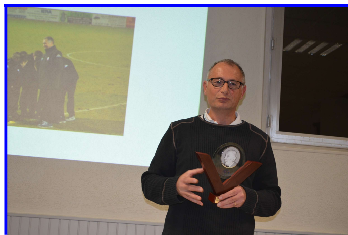
Le récipiendaire du challenge Georges Boulogne