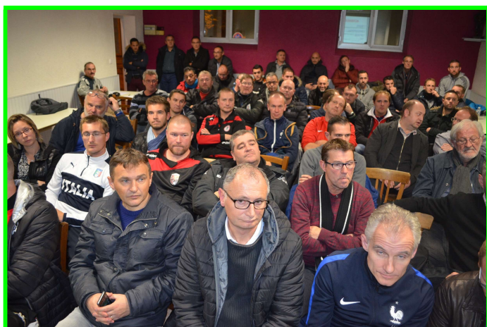
Une salle attentive