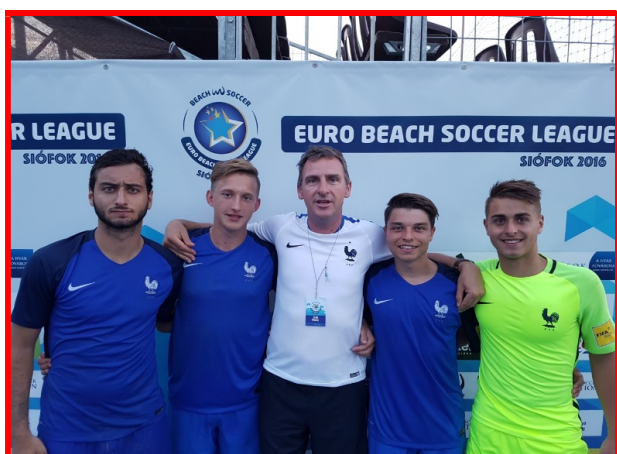
Les 4 nordistes de la sélection nationale Beach Soccer « U 21 »

En outre, quelques joueurs de la région se sont fait remarquer dans les sélections nationales « U 21 » et A, des rencontres inter-ligues ayant eu lieu pour détecter les talents.