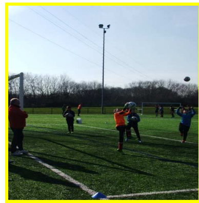
Une séance découverte pour de jeunes gardiens de but

Le nombre de places est limité, les inscriptions sont prises dès à présent. Pour tout renseignement, demande d'informations, inscriptions, un numéro de téléphone : 06-52-23-01-05