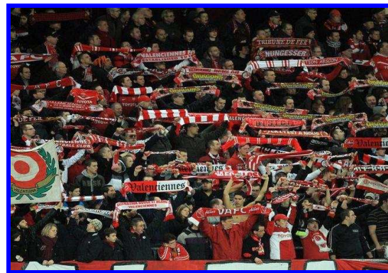
Une soirée conviviale et festive autour d'un merveilleux spectacle pour encore mieux aimer le foot...