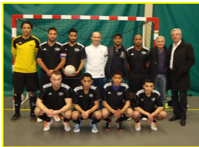
Équipe 1 de Tétéghem Futsal