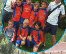
U8 de Grasse