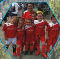
U6 de Mouvans Sartoux