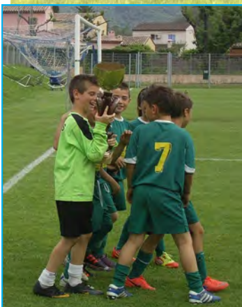
Mandelieu remporte le challenge « Mus » BOUREGBA

Pas de compétition, seulement l'envie de taper la balle tous ensemble.