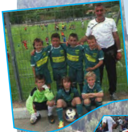
Ug de Mandelieu

U.S. PEGOMAS TOURNOI DES JEUNES POUSSES U6, U7, U8 et U9 2 juin 2012 Complexe Gaston MARCHIVE