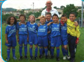
U6 de Pégomas