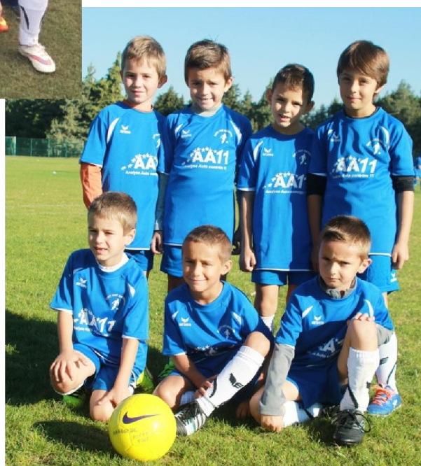
U 8 District