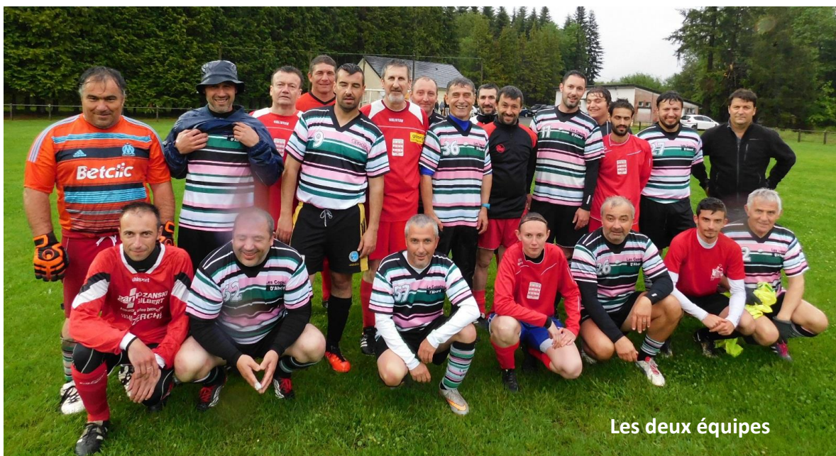
Les deux équipes