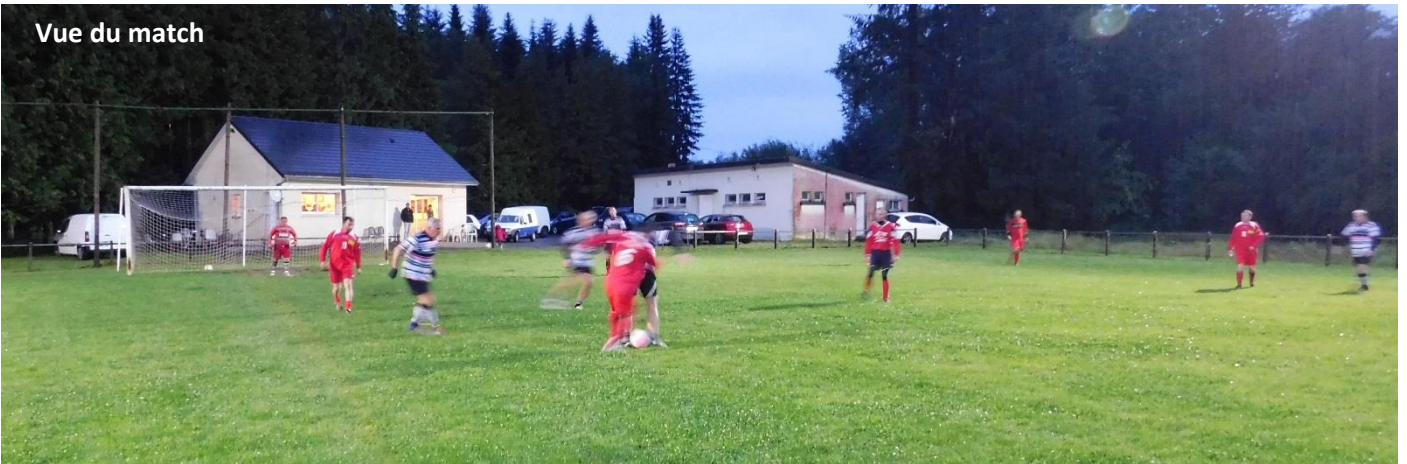
Vue du match