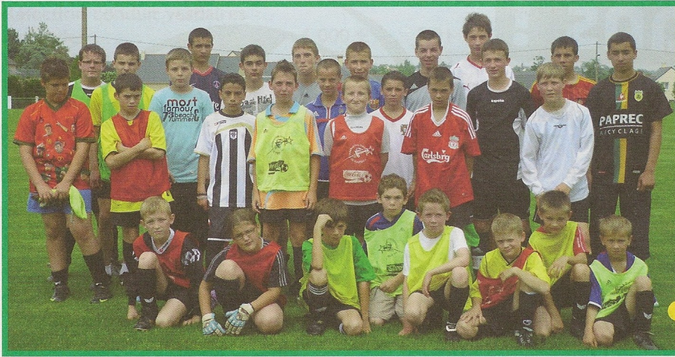
Les jeunes ayant pris part au Challenge des Mouettes