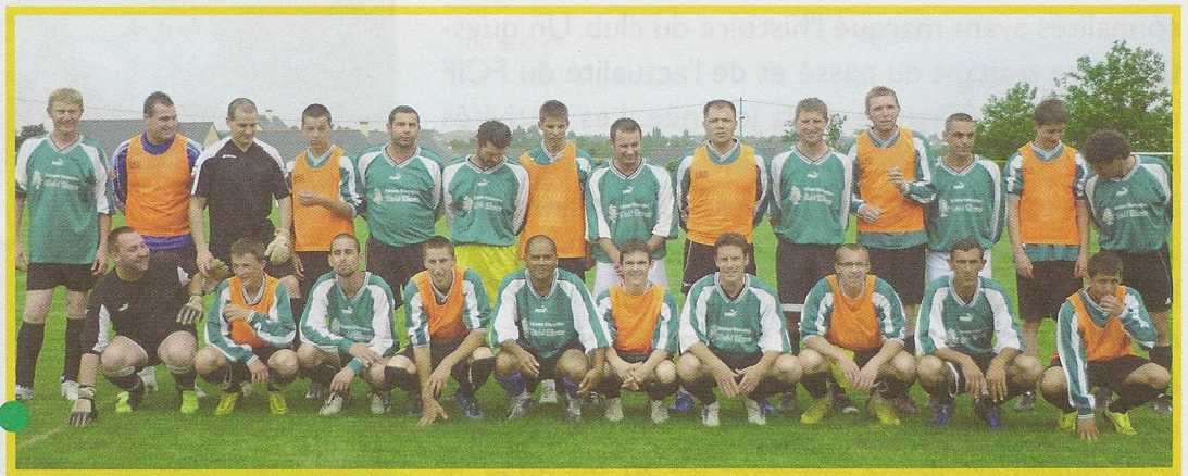
Première confrontation : les joueurs des années 2000