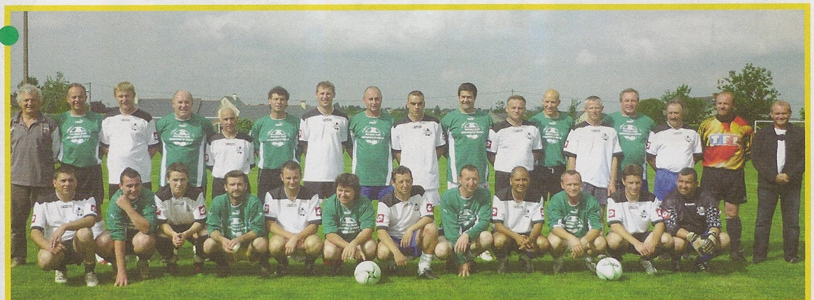
Troisième opposition : les joueurs des années 90