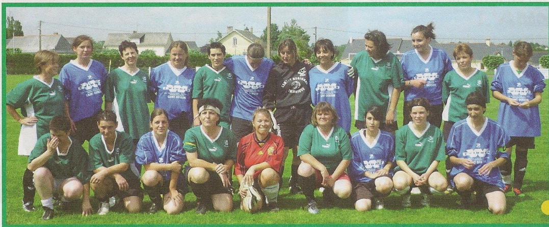
Deuxième confrontation : les Féminines