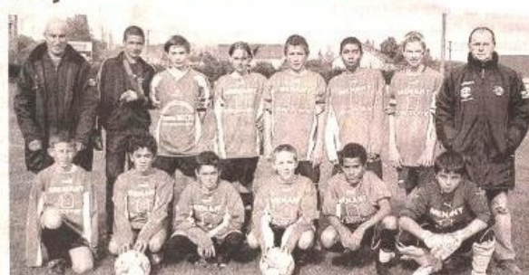
L'équipe des jeunes (catégorie U15) évolue désormais en Première Division.

Après leur beau parcours en Coupe de l'Anjou, terminé par une défaite au 4 e tour face à une équipe de niveau supérieur, les jeunes joueurs du club jouaient en Challenge de l'Anjou. Dès leur premier match dans cette compétition, un défi de taille leur était proposé avec le SC Beaucozéz, membre de l'élite départementale, comme adversaire. Malgré l'ouverture du score par le FCIF, la hiérarchie a été respectée