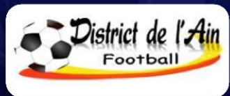
Schéma régional et national de la pratique