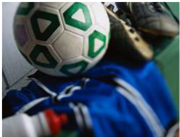
Un vestiaire équipé de douches

Le Collège LE FAIRAGE est situé à proximité d'un gymnase adapté à la pratique du football avec des vestiaires équipés de douches et un terrain de foot gazonné. La proximité de l'ensemble de ces installations permet de limiter les déplacements et un gain de temps pour réaliser d'autres activités.