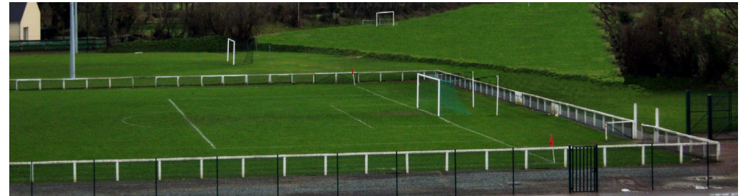
Un terrain de foot gazonné...