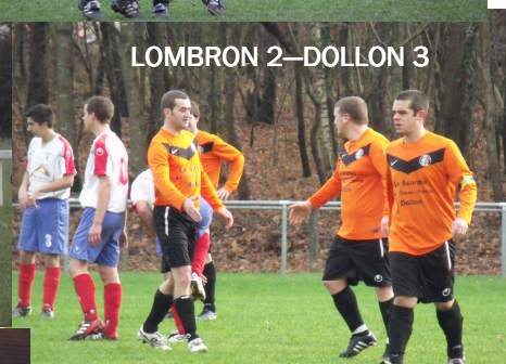
LOMBRON 2—DOLLON 3