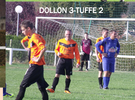
DOLLON 3-TUFFE 2