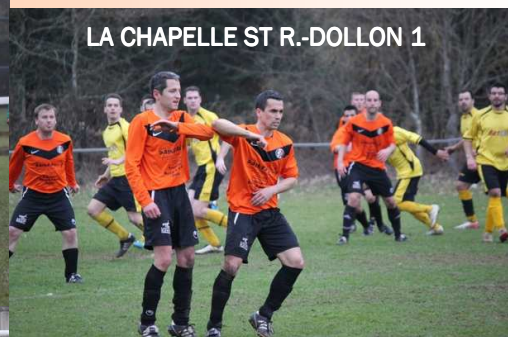
LA CHAPELLE ST R.-DOLLON 1