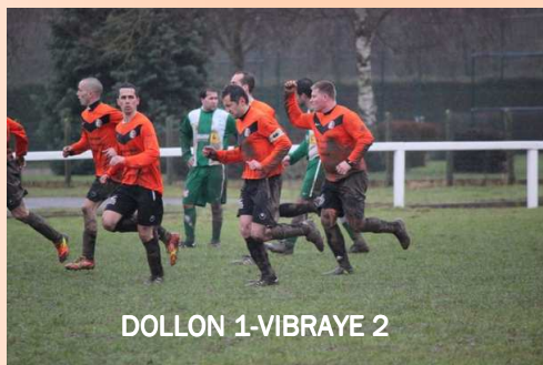
DOLLON 1-VIBRAYE 2

Voici quelques photos des 3 équipes prises par Amélie :