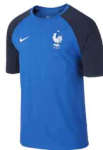
T-SHIRT MATCH NIKE