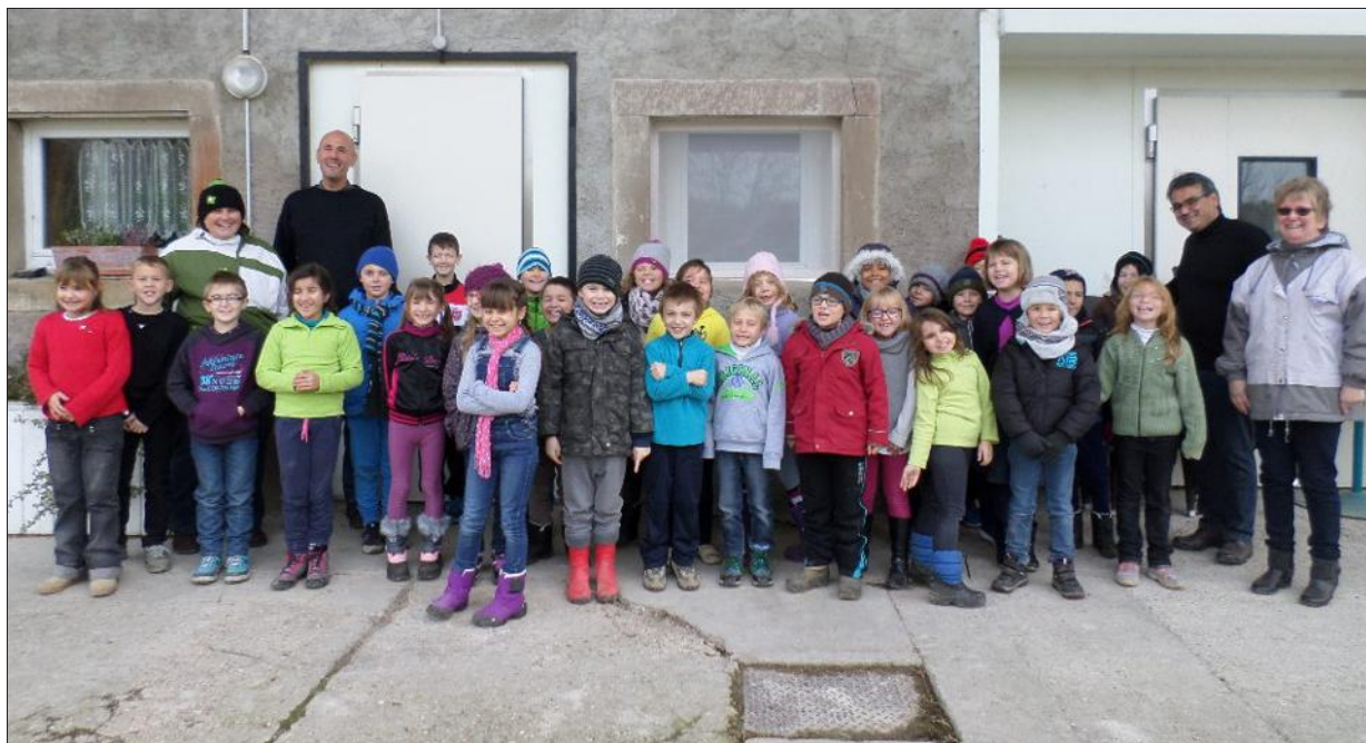
Belle initiation au quotidien dans une ferme pour les élèves du groupe scolaire.

La leçon n'est jamais aussi bien apprise et retenue que lorsqu'elle se déroule en dehors de l'école. Les primaires ont découvert et expérimenté la vie à la ferme.