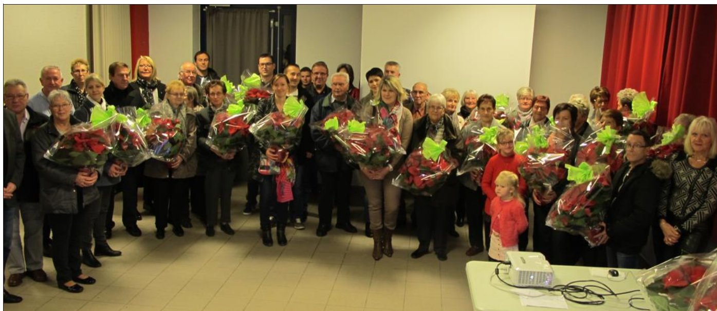
Les fleurs de l'été ont été évoquées durant une soirée et les mains vertes récompensées.

Quarante habitants ont été récompensés par la commune pour le fleurissement de leur habitation suite au 14e concours des maisons fleuries du village. Contrairement aux années précédentes, il n'a pas été question de palmarès ni de compétition, mais le jury a sim-