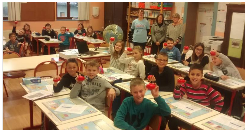
Le don du sang n'a plus de secret pour les écoliers.

Avec photos à l'appui, les élèves ont aussi découvert le déroulement d'une collecte et ont été invités à venir voir com-