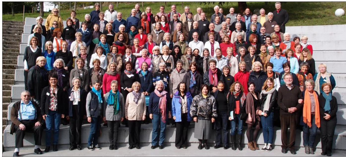
80 choristes et 23 instrumentistes placés sous la prestigieuse baguette de Edlira Priftuli.

Une vingtaine d'arbres, d'essences diverses, fournis par AB Paysage d'Eschwiller attendaient les enfants qui se sont donc retrouvés, nombreux, dès les premières heures du jour, sur le site avec les outils adéquats et surtout