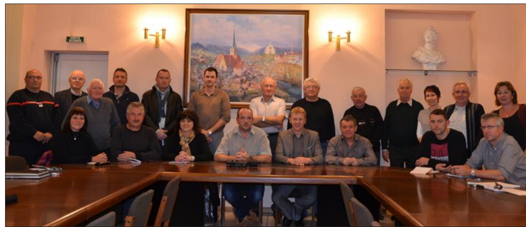
Les participants à la réunion ont réglé et défini le parcours du souvenir de la libération.

À 14 h, mise en place au niveau du stade d'Abreschviller ; à 14 h 30 départ vers le pont de la Libération et dépôt de gerbe ; à 15 h 30, célébration à l'épingle de Saint-Léon à Walscheid et dépôt de gerbe et à 16 h 30, célébration au monument aux morts de Troisfontaines et dépôt de gerbe.