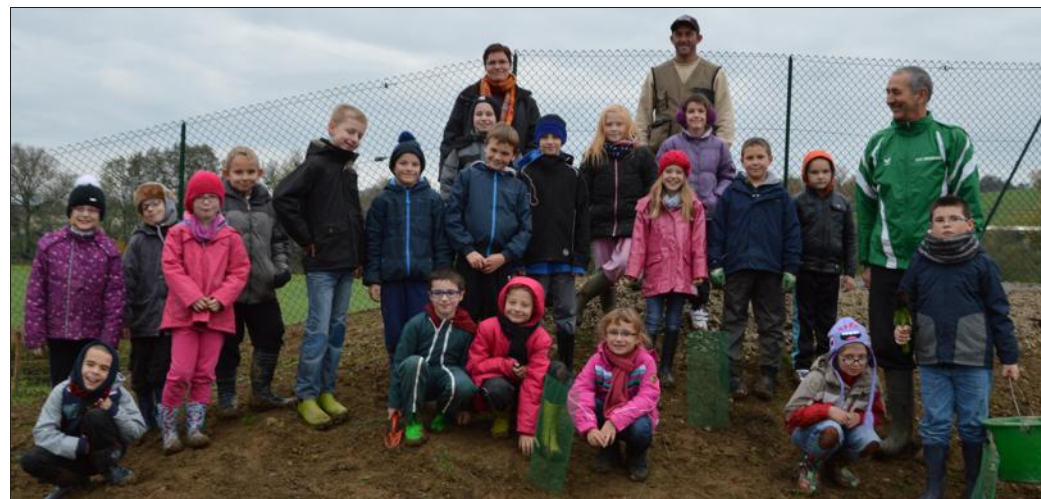
Les élèves sont très fiers d'avoir participé à l'opération " plus d'arbres, plus de vie ".

Rhin. Ainsi, choristes et instrumentistes proposeront deux pièces. En première partie Jan Dismas Zelenka (1679-1745) d'une durée d'environ 15 minutes, puis un requiem de W. A. Mozart (1756-1791) d'une durée d'une heure.