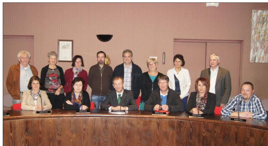
Le sénateur Jean-Louis Masson à la rencontre des élus.

Dans le cadre de sa visite des territoires et des rencontres avec les élus, le sénateur Jean-Louis Masson a rencontré les élus locaux pour une réunion d'information sur la réforme territoriale.