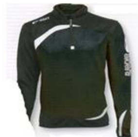
Sweat zip mondial