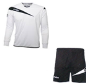
Kit entrainement ML

Tailles disponibles : XXXS, XXS, XS, S, M, L, XL, XXL