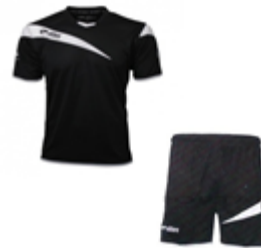
18 Kit entrainement MC