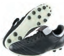
Crampons « moulés » Terrain sec ou dur

Pour entretenir ses chaussures de foot et les faire durer plus longtemps :