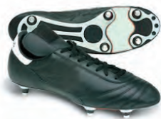
Crampons « vissés » Terrain gras ou humide